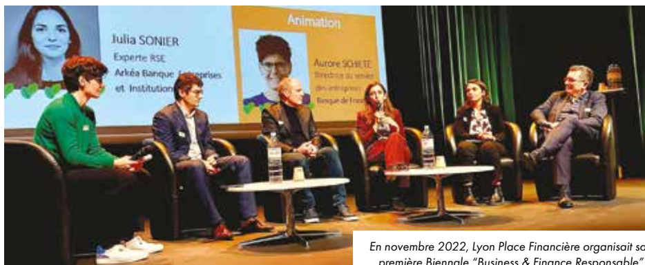
En novembre 2022, Lyon Place Financière organisait sa première Biennale "Business & Finance Responsable".

Investir et se transformer pour un avenir durable, c'est bien tout l'enjeu de la transition écologique dont la finance responsable est l'un des piliers. Rendez-vous le 27 novembre !