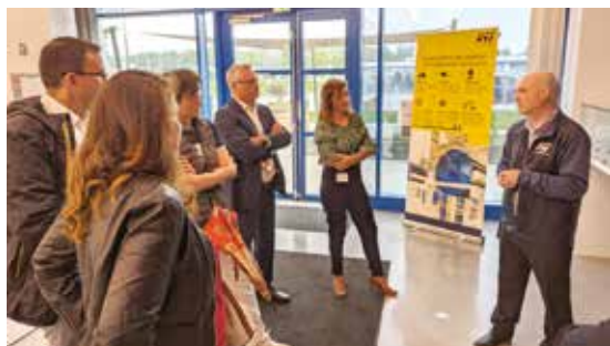
STMicroelectronics est le 5 ème fabricant mondial de semi-conducteurs.

Le temps des visites in situ passé, place au cocktail déjeunatoire où Minalogic avait