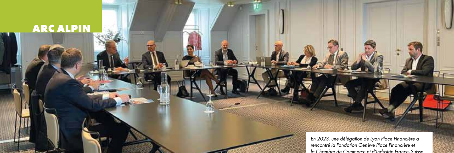
En 2023, une délégation de Lyon Place Financière a rencontré la Fondation Genève Place Financière et la Chambre de Commerce et d'Industrie France-Suisse.