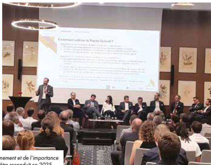
Face au succès de cet événement et de l'importance de ce thème, il pourrait être reconduit en 2025.